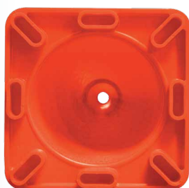
Base con 8 puntos de apoyo.